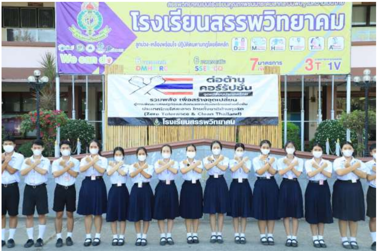
คณะกรรมการสภานักเรียนโรงเรียนสรรพวิทยาคม