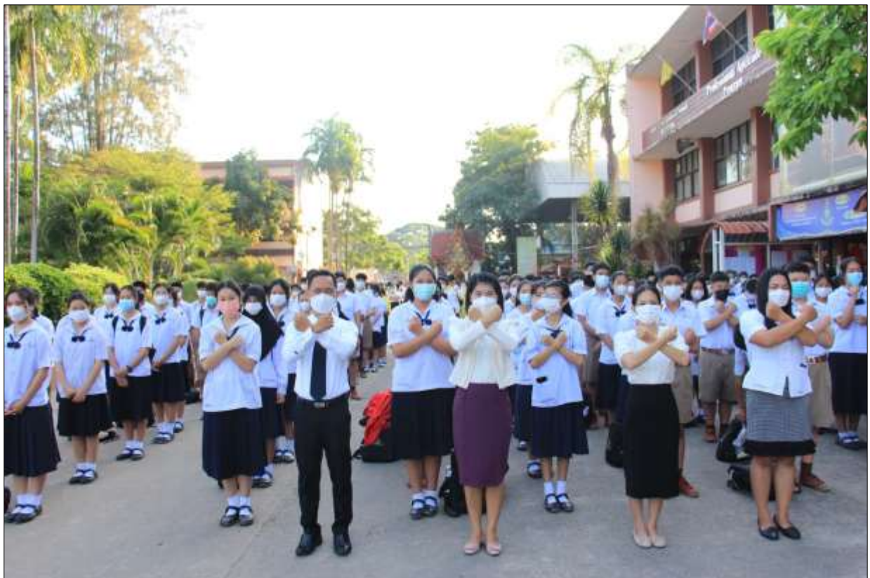
คณะครูและนักเรียน ระดับมัธยมศึกษาตอนต้น