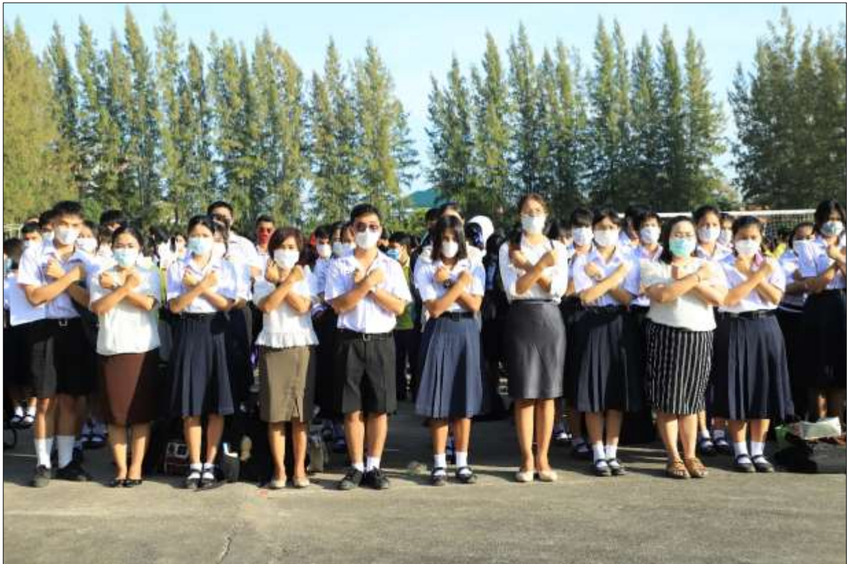
คณะครูและนักเรียน ระดับมัธยมศึกษาตอนปลาย